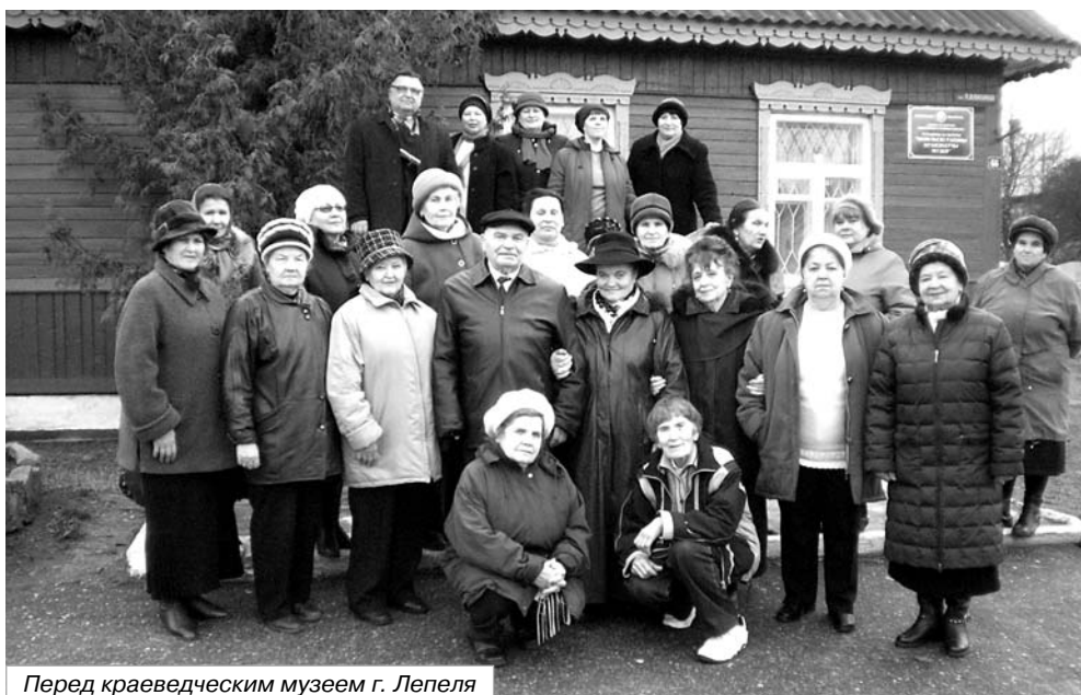
Перед краеведческим музеем г. Лепеля

нам были предоставлены двухкомнатные номера.