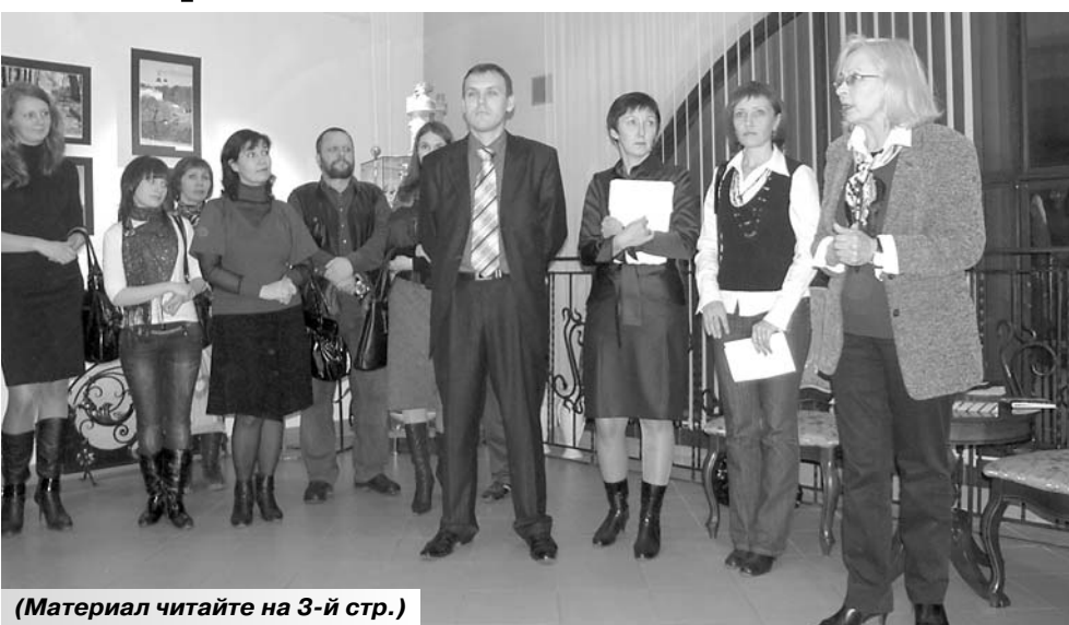
(Материал читайте на 3-й стр.)